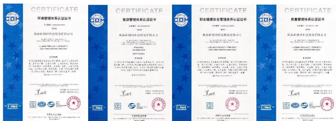
公司一体化管理体系认证证书

2021 年 10 月，公司开展了 2021 年度体系管理内部审核。审核组按照计划安排，由审核组长带领 17 名审核员分别对公司所在的滕州 17 个部门及场所、常州 11 个部门及场所进行了审核，共发现问题 70 个。其中不符合项 10 个，观察项 60 个。所有不符合项、观察项均于 2021 年 12 月 31 日前完成了整改验证。