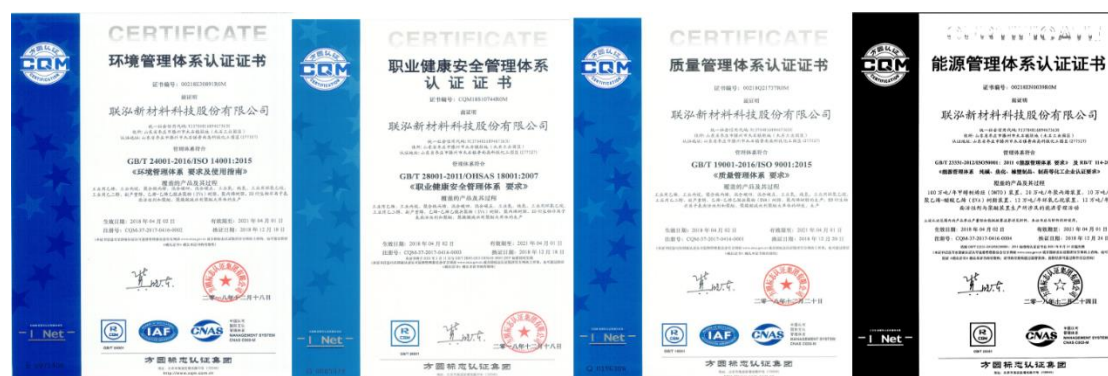
公司一体化管理体系认证证书

公司 2016 年 12 月获得了质量管理体系认证证书。2017 年 3 月建立了质量、能源、环境、职业健康安全一体化管理体系，编制了《一体化管理手册》、《一体化管理体系内部审核管理办法》，规定了一体化管理体系内部审核的方法和频次。2018 年通过了方圆认证集团有限公司山东分公司的认证，并于 2018 年 4 月 2 日颁发认证证书。