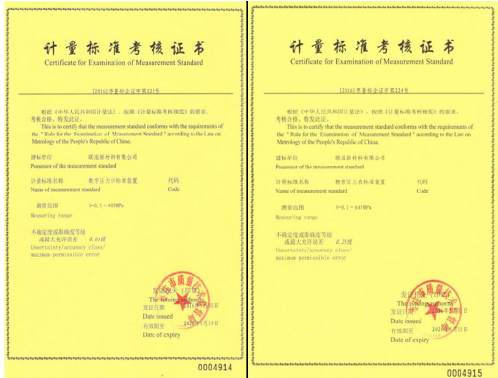
计量标准考核证书

公司自检压力变送器、差压变送器检定 1510 块，压力表检定 1296 块，温度仪表校准 44 台。全年没有出现因计量不准确造成的重大质量投诉。