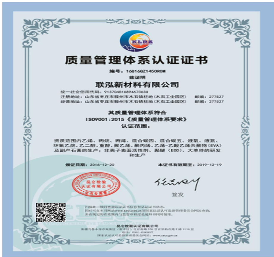
公司质量管理体系认证证书